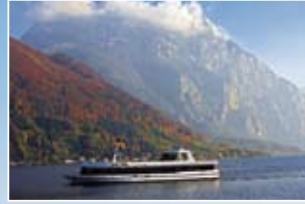
Herbststimmung mit MS „Karl Eder“