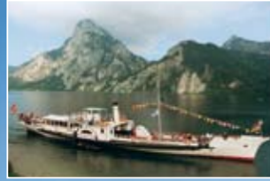
Die „Gisela“ vor Traunkirchen