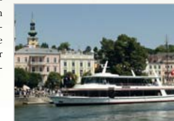
Der Weg in die Zukunft: die „Poseidon“

Lange vor der Eisenbahn und dem Automobil nutzten die Menschen hier im Salzkammergut das Boot als Transportmittel. Die Wurzeln unseres Unternehmens reichen bis 1839 zurück, als die Linienschifffahrt auf dem Traunsee aufgenommen wurde – eine Tradition, versinnbildlicht durch die 1871 gebaute, heute noch dampfende „Gisela“, dem unter Denkmalschutz stehenden, ältesten Raddampfer der Welt. Die Moderne der Traunseeschifffahrt – die älteste und größte Privatreederei Österreichs – wird durch die „Poseidon“ repräsentiert, ein modern ausgestattetes Schiff. So bilden heute einerseits die langjährige Tradition, andererseits ein zukunfts- und vor allem kundenorientiertes Denken die Pfeiler unserer Unternehmensphilosophie.