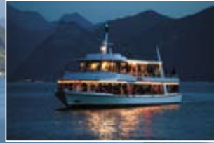
MS „Poseidon“ bei Nachtfahrt